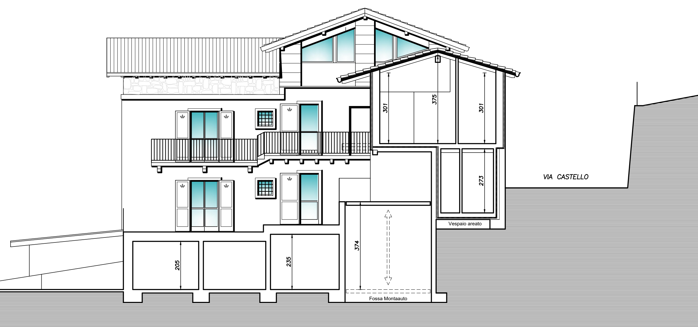
PROSPETTO EST SCALA 1:100