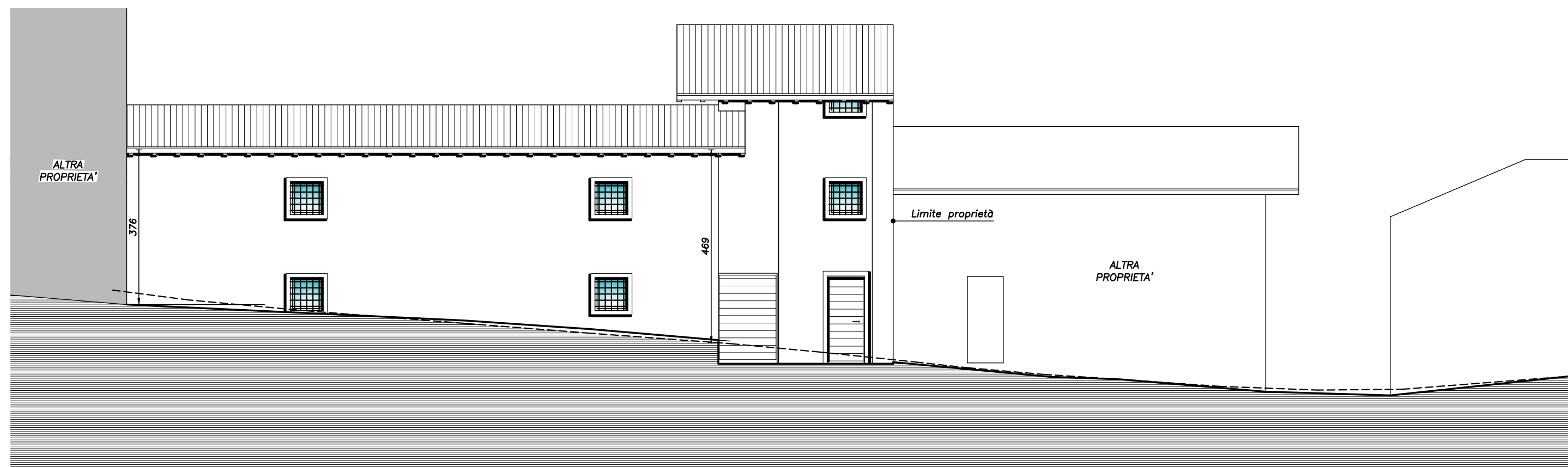
PROSPETTO NORD CON PROFILO STRADA SCALA 1:100