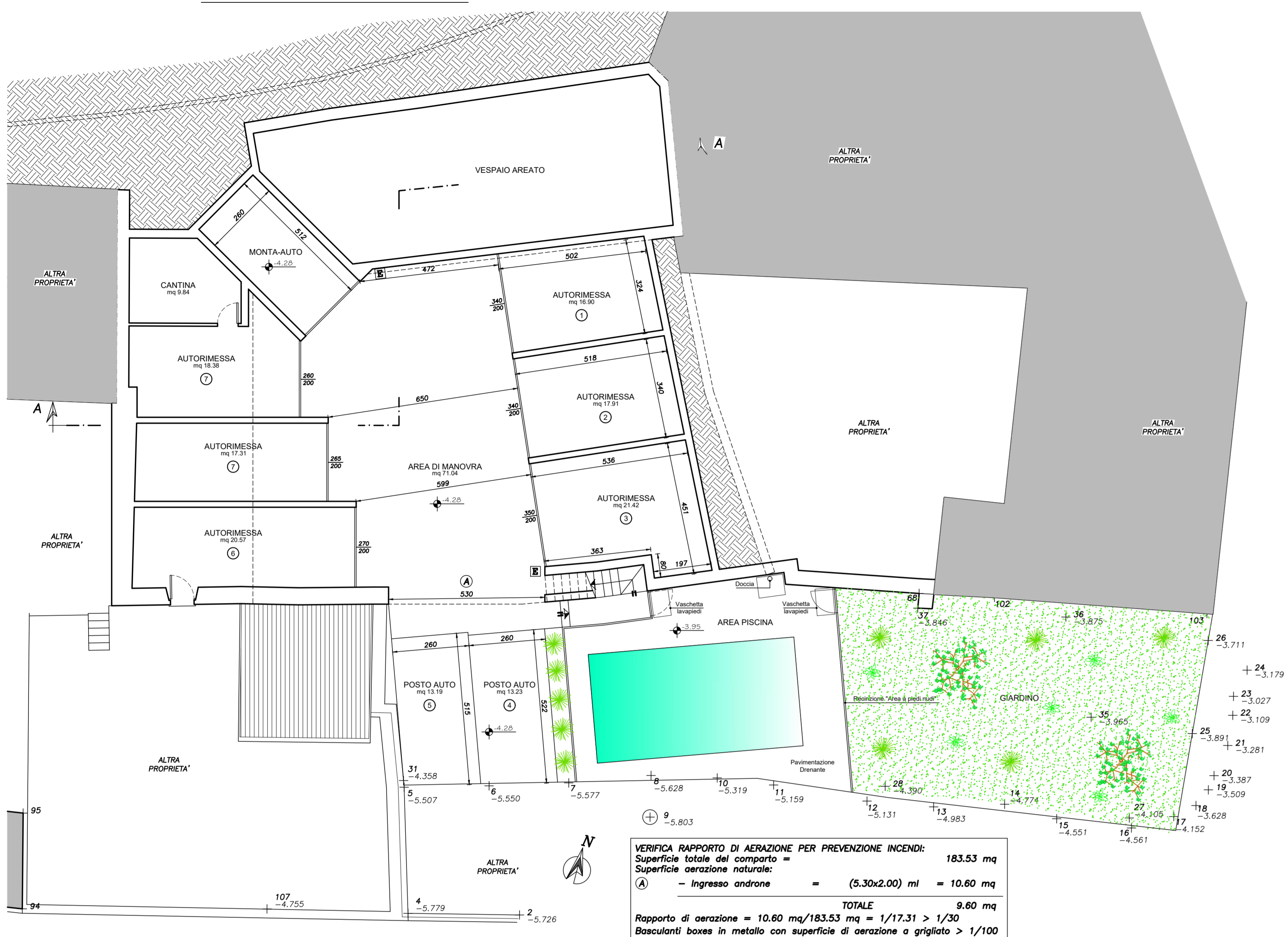
PIANTA PIANO INTERRATO SCALA 1:100

VERIFICA RAPPORTO DI AERAZIONE PER PREVENZIONE INCENDI: Superficie totale del comparto = 183.53 mq Superficie aereazione naturale = 10.60 mq - Ingresso androne = (5.30x2.00) ml = 10.60 mq TOTALE Rapporto di aereazione = 10.60 mq/183.53 mq = 1/17.31 > 1/30 Basculanti boxes in metallo con superficie di aereazione a grigliato > 1/100