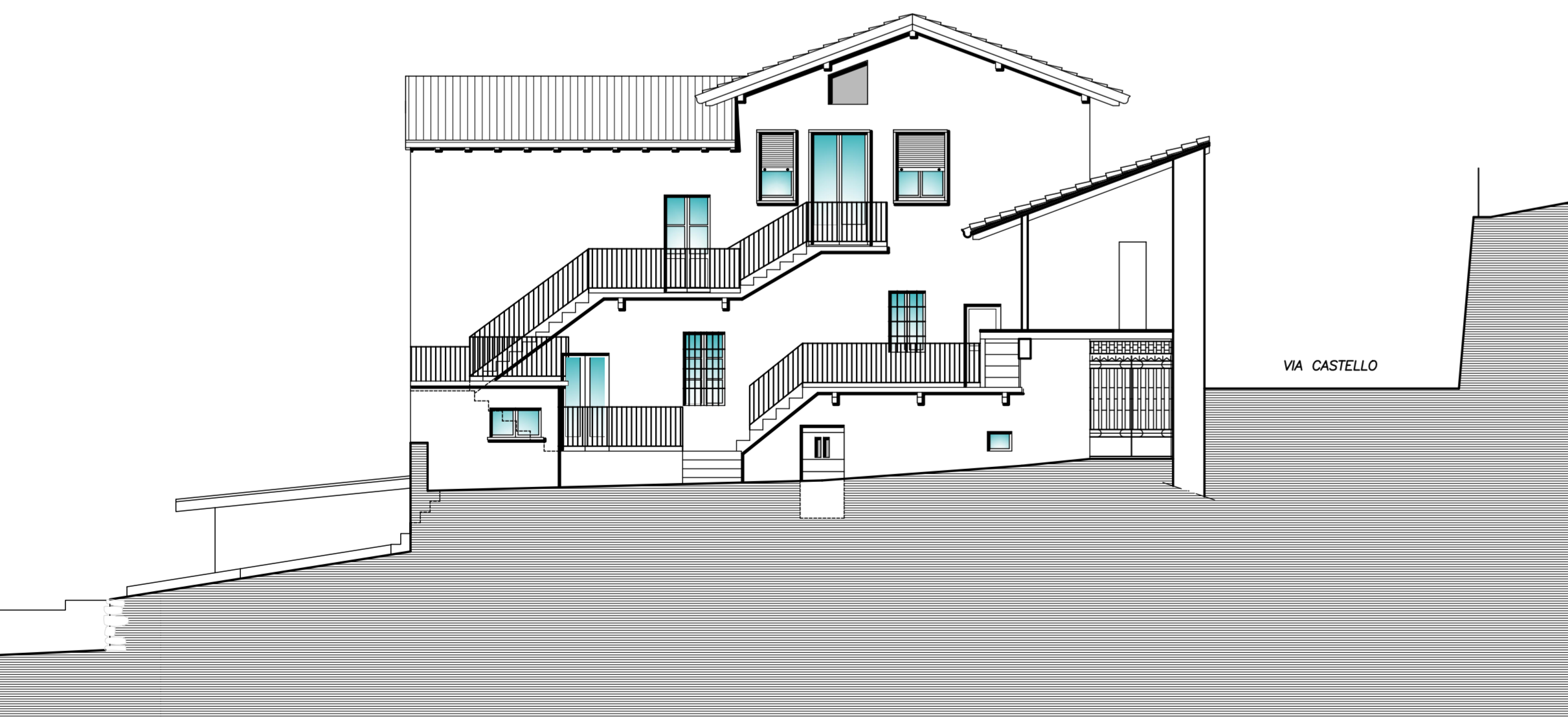
PROSPETTO EST SCALA 1:100