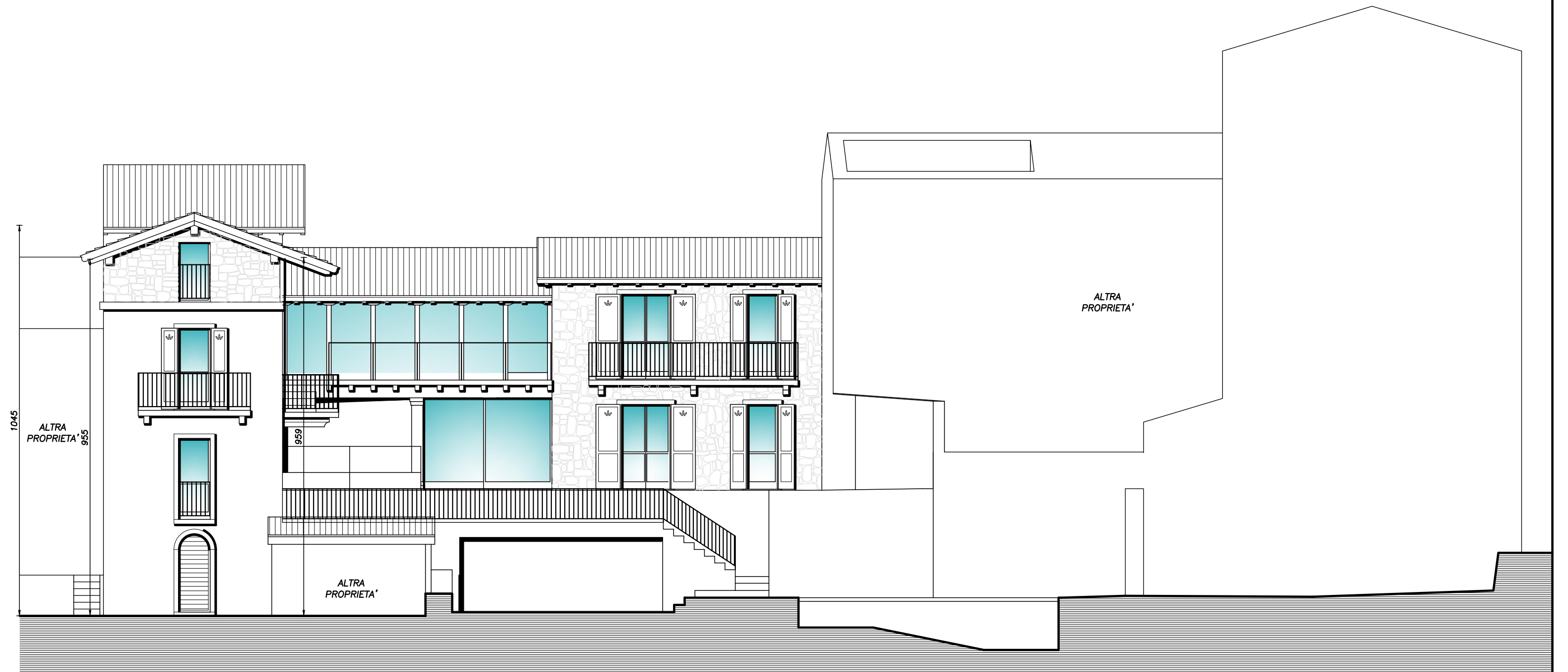
PROSPETTO SUD SCALA 1:100