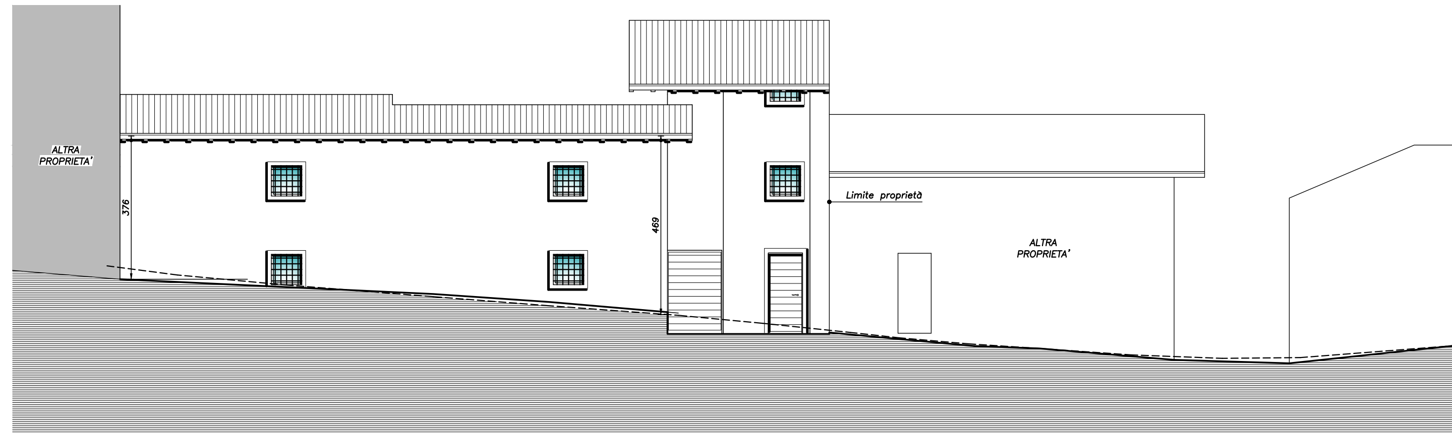
PROSPETTO NORD CON PROFILO STRADA SCALA 1:100