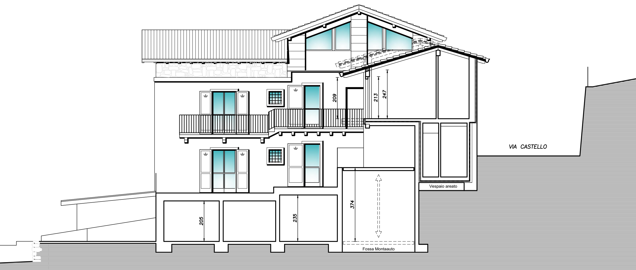
PROSPETTO EST SCALA 1:100