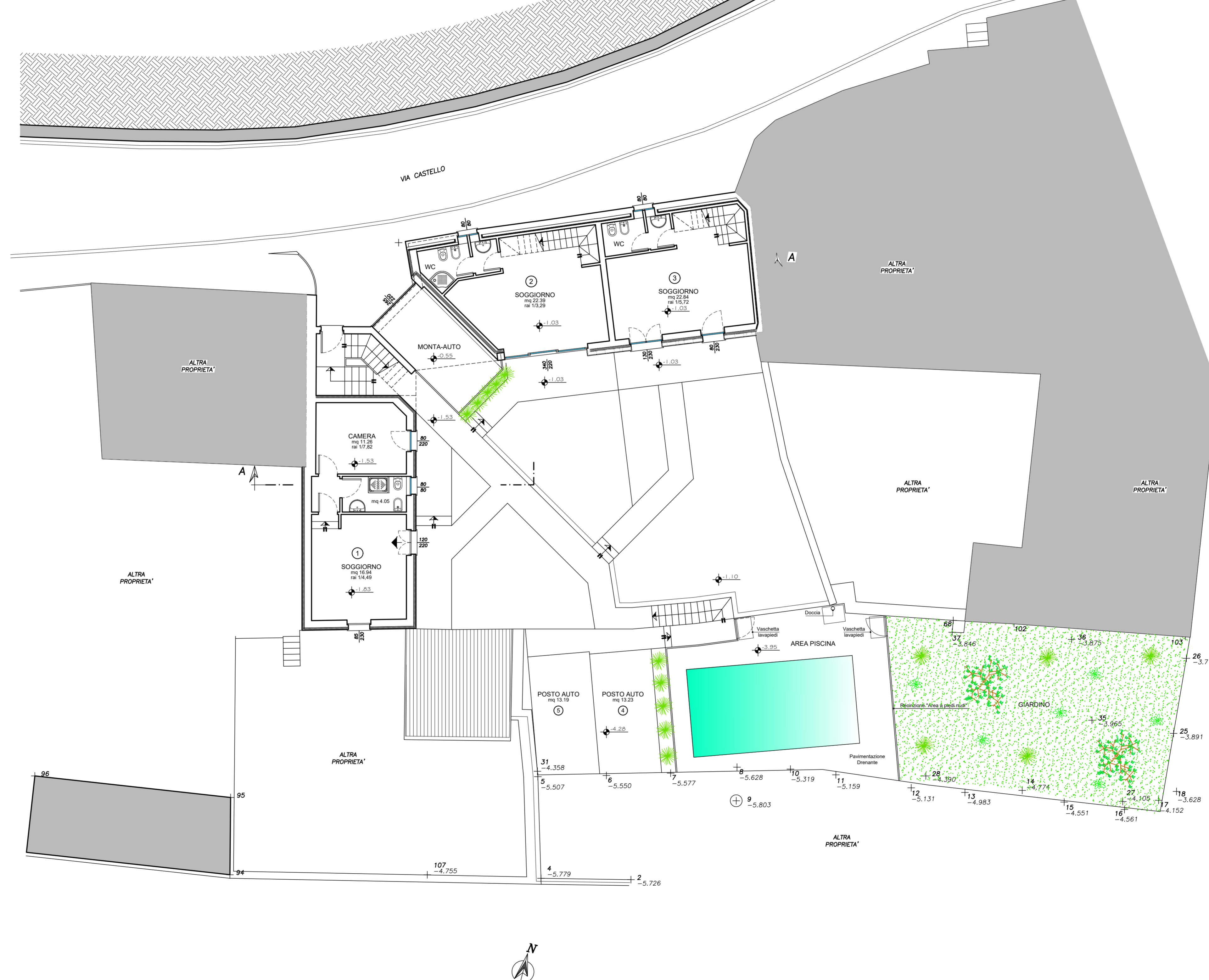
PLANIMETRIA GENERALE CON PIANTE PIANO TERRA SCALA 1:100

COMUNE DI RIVA DI SOTTO PROVINCIA DI BERGAMO